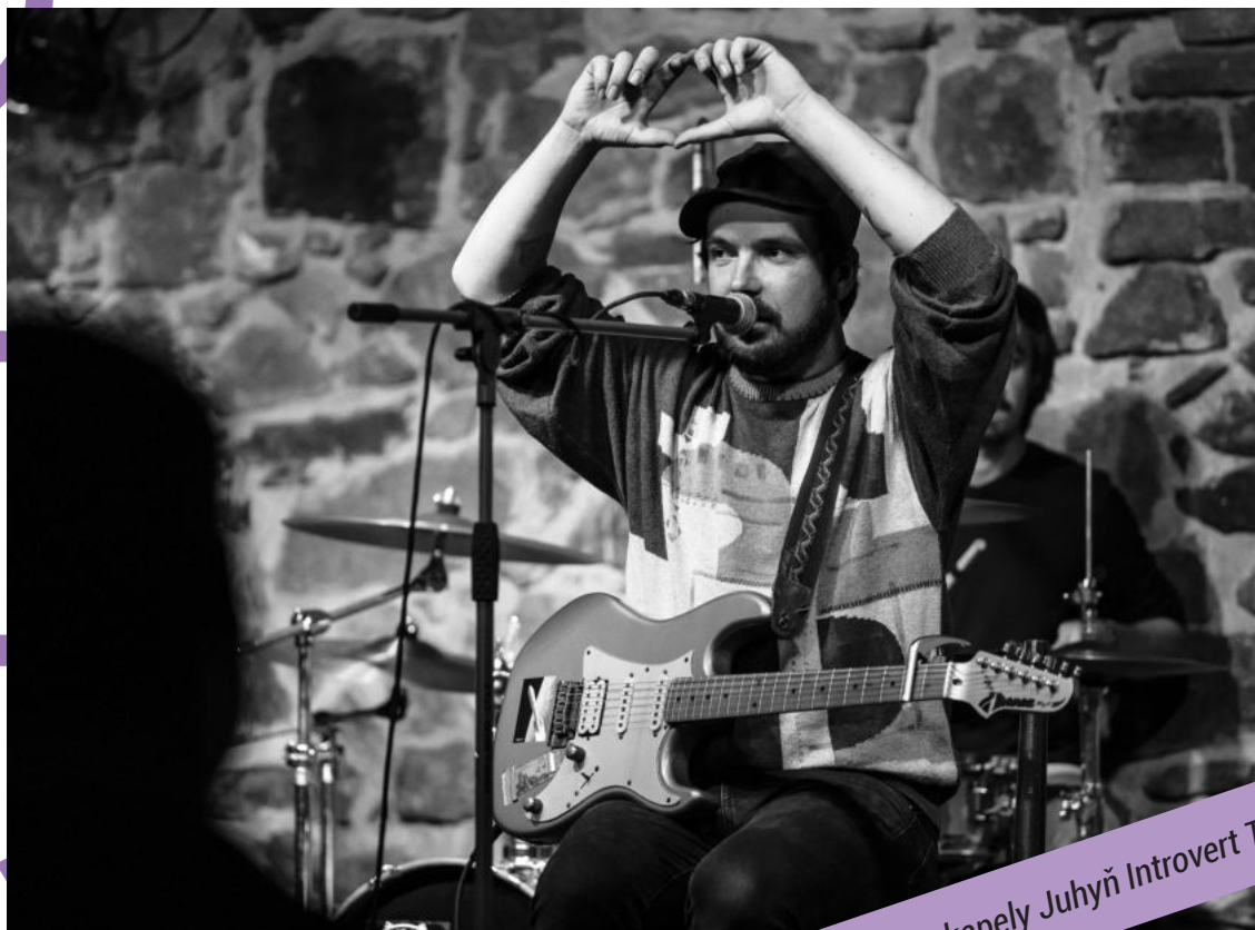
Frontman kapely Juhýň Introvert Trio