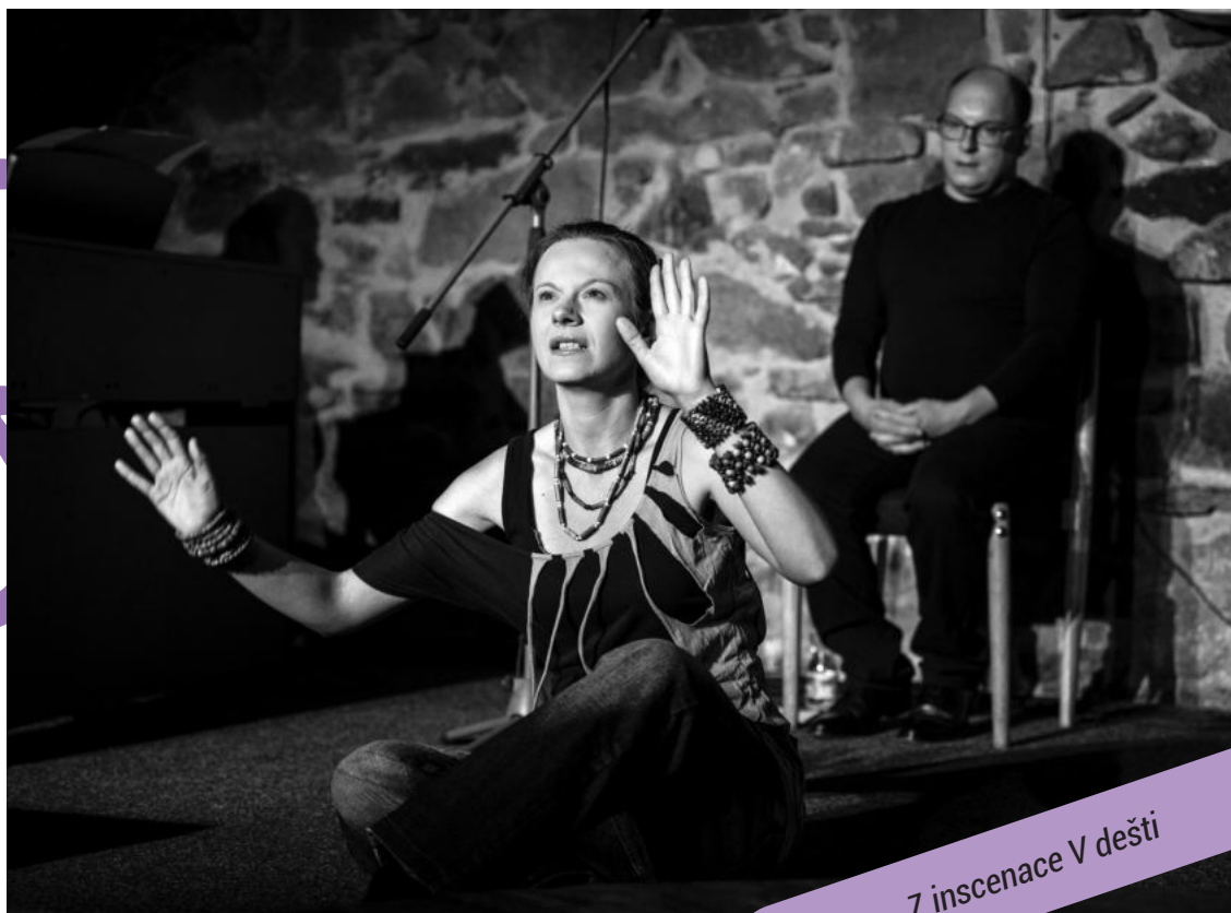
Z inscenace V dešti